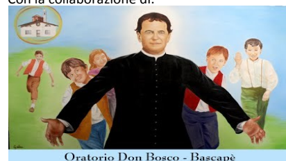
Oratorio Don Bosco - Bascapè